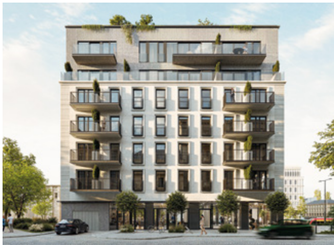
NDI SMOLNA 23

która może pełnić funkcję miejsca do pracy, hobby, ale też spotkań w męskim gronie – wylicza prezes NOHO Investment. W projektach takich jak NOHO ONE czy Dolnych Młynów 10 rozwijane są cieszące się popularnością koncepty pokoi cygarowych, symulatorów golfa czy jazdy samochodem.