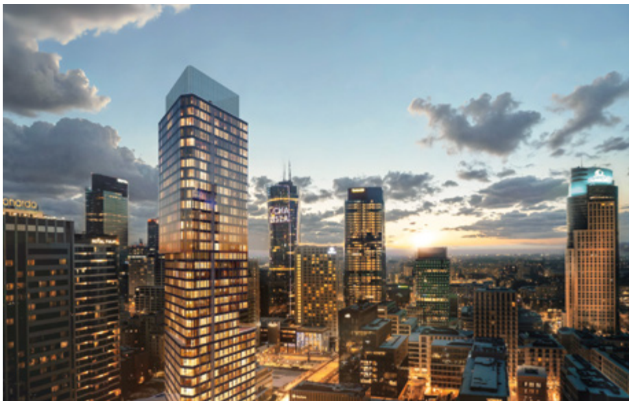
LIBERTY TOWER BY CAVATINA

decyzyjne są u nich znacznie dłuższe. Nabywcy oczekują gotowego produktu najwyższej jakości, chcą precyzyjnie ocenić każdy detal architektoniczny i osobiście zweryfikować standard wykonania. Doświadczenie uczy też, że zapotrzebowanie na najwyższy standard wymaga odpowiedniej oprawy wizualnej. – Proces sprzedaży przebiega znacznie sprawniej, gdy oferujemy nieruchomości w pełni ukończone, kompleksowo przygotowane i perfekcyjnie zaprezentowane – zaznacza Wróbel.